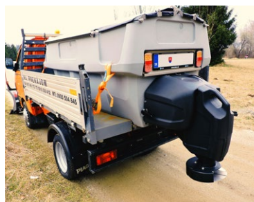
SYPAČ H 850

Vďaka svojim malým rozmerom a vynikajúcej manérovateľnosti sú vozidlá Piaggio 4x4 vybavené sypačom a radlicou ideálnym nástrojom na zimnú údržbu peších zón, chodníkov a rôznych areálov firiem. Na odhrňanie snehu slúži radlica, ktorú možno jednoducho namontovať a demontovať prostredníctvom dvojbodového mechanizmu. Vybavená je hydraulickými valcami pre zdvih a bočné natáčanie v oboch smeroch, protinárazovým systémom a značkami pre indikáciu šírky. Šírka záberu radlice je 1,6 - 2 m. Radlica môže byť šípová alebo priama. Všetky posýpače majú ovládanie šírky a množstvo posypu priamo v kabíne vozidla.